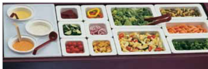
Ideal en las barras de ensaladas Cambro o para enfriar condimentos, jarras de crema, y aderezos.